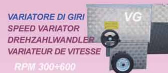
VARIATORE DI GIRI SPEED VARIATOR DREHZAHLOWANDLER VARIATEUR DE VITESSE