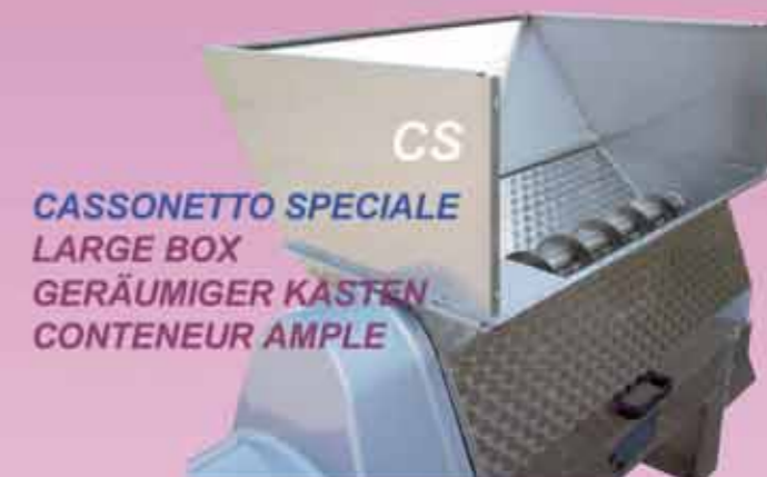
CASSONETTO SPECIALE LARGE BOX GERÄUMIGER KASTEN CONTENEUR AMPLE