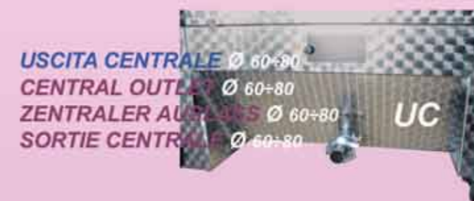
USCITA CENTRALE Ø 60+80 CENTRAL OUTLET Ø 60+80 ZENTRALER AUSLAß Ø 60+80 SORTIE CENTRALE Ø 60+80