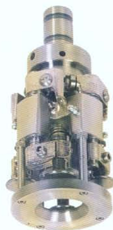
Testina a rulli con centratore